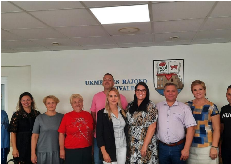
Su NVO taryba

Dalyvavau mokymuose „Viešųjų paslaugų teikėjų (sporto, kultūros, švietimo ir socialinės apsaugos srityse) finansavimas“, taip pat savivaldybėje vykusiame renginyje „Bendruomenių saugumo užtikrinimas ir bendradarbiavimas su policija“.