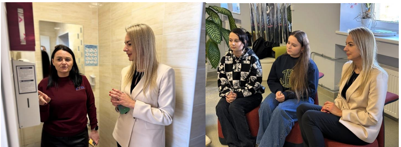
Apsilankymas švietimo įstaigose

Džiaugiuosi, kad metų pradžioje mano iniciatyva pateiktas pasiūlymas Ukmergės rajono pagrindinių mokyklų, progimnazijų ir gimnazijų tualetuose įrengti nemokamų higienos priemonių prieigas mergaitėms buvo palaikytas ir įgyvendintas. Spalio mėnesį lankiausi švietimo įstaigose, kur buvo apžiūrėtos įrengtos dozatorių dėžutės ir su mokinėmis aptarta šios iniciatyvos praktinė nauda.