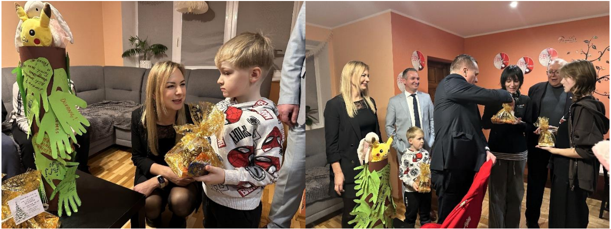
Apsilankymo metu šeiminiuose globos namuose

Džiaugiuosi, kad metų pradžioje mano iniciatyva pateiktas pasiūlymas Ukmergės rajono pagrindinių mokyklų, progimnazijų ir gimnazijų tualetuose įrengti nemokamų higienos priemonių prieigas mergaitėms buvo palaikytas ir įgyvendintas. Spalio mėnesį lankiausi švietimo įstaigose, kur buvo apžiūrėtos įrengtos dozatorių dėžutės ir su mokinėmis aptarta šios iniciatyvos praktinė nauda.