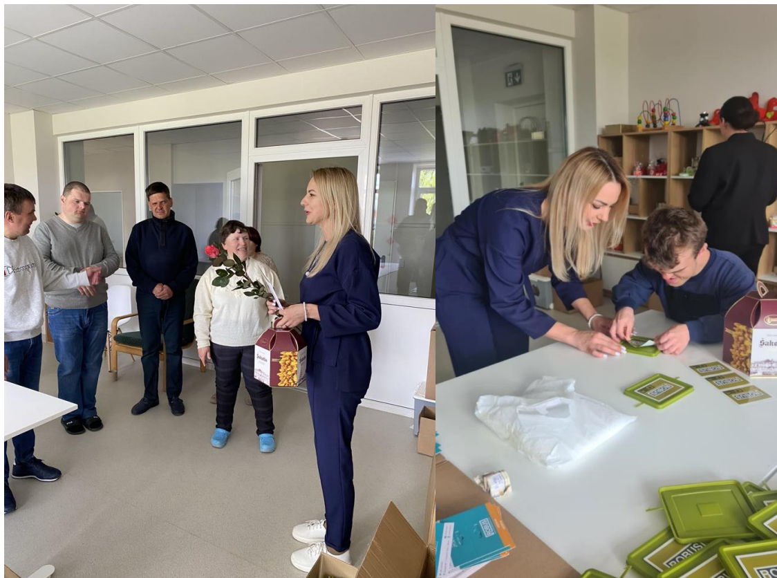
„Ukmergės viltis“ socialinėse dirbtuvėse

Minint Europos žmonių su negalia savarankiško gyvenimo dieną, apsilankiau „Ukmergės Viltis“ socialinėse dirbtuvėse, kur vyko atvirų durų diena. Renginio metu turėjau galimybę susipažinti su dirbtuvių lankytojais ir darbuotojais, apžiūrėti jų gaminamą produkciją, iš arti pamatyti kasdienes veiklas, kurios skatina žmonių su negalia savarankiškumą, užimtumą ir profesinį tobulėjimą.