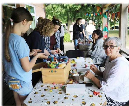
23 pav. Jakutiškio kaimo 280-ojo gimtadienio šventė