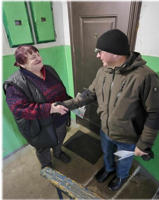
6 pav. Kalėdinių dovanų įteikimas