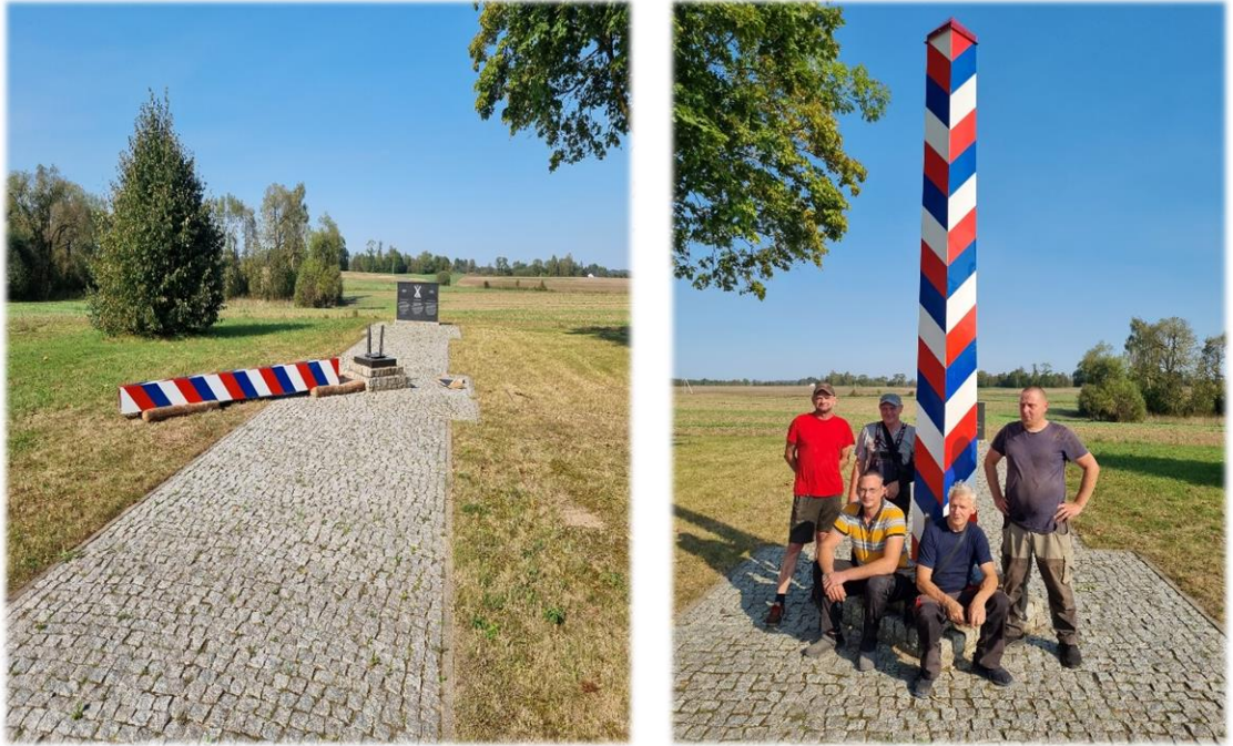
9 pav. Rekonstruotas memorialinis obeliskas 1812 m. Deltuvos mūšiui atminti

- restauruotas paminklas 1831 m. žuvusiems sukilimo dalyviams atminti Skerdimų kalne (Žr. 10 pav.);