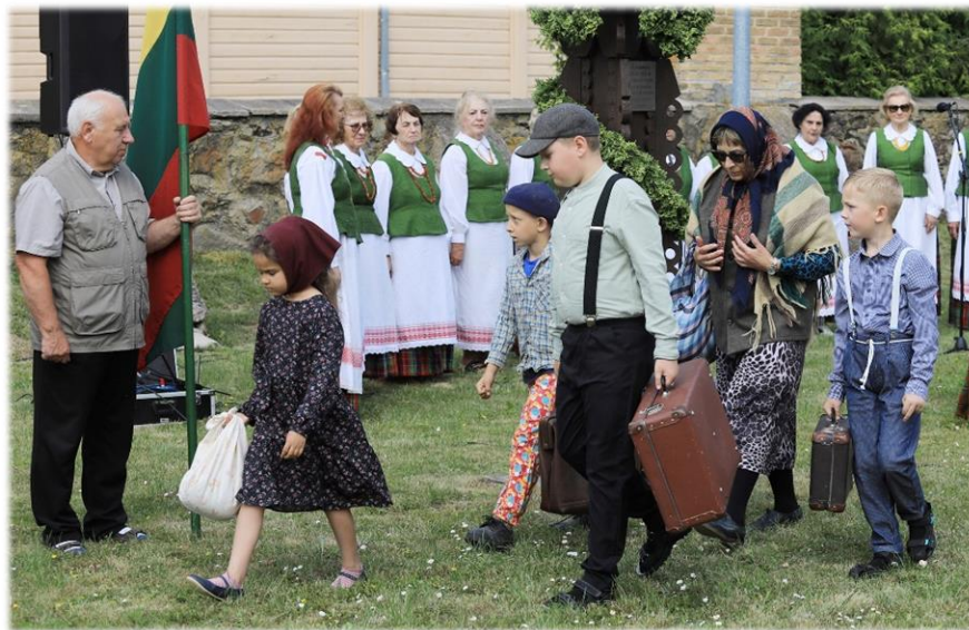
18 pav. Gedulo ir vilties diena Deltuvoje

- Liepos 6-ąją – Valstybės (Lietuvos Karaliaus Mindaugo karūnavimo) dieną Tautiškos giesmės giedojimas Deltuvoje (Žr. 19 pav.);