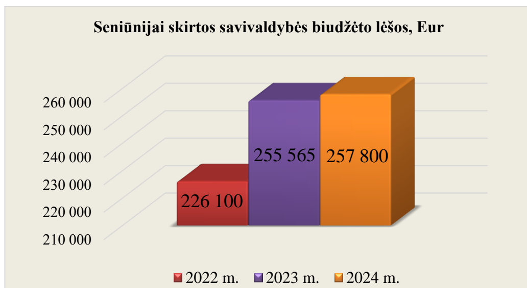
2 pav. Seniūnijai skirtų savivaldybės biudžeto lėšų pokytis 2022-2024 m.

Seniūnijai skirtų savivaldybės biudžeto lėšų kitimas nuo 2022 m. iki 2024 m. pateiktas diagramoje (Žr. 2 pav.).