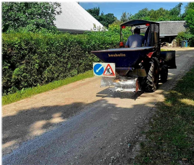
15 pav. Žvyrkelių barstymas kalčio chlorido druska