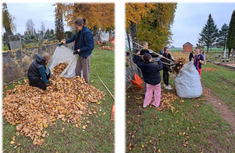
7 pav. Rudeninė lapų grėbimo talka