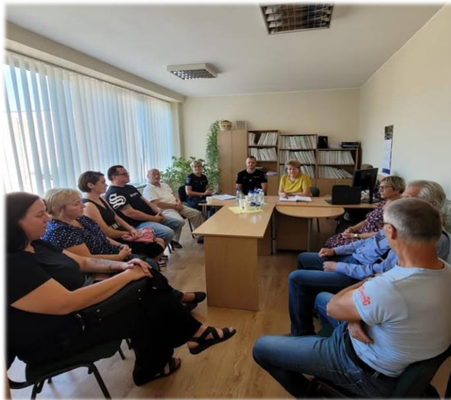
3 pav. Susitikimas su Vilniaus apskrities VPK Ukmergės rajono policijos komisariato atstovais