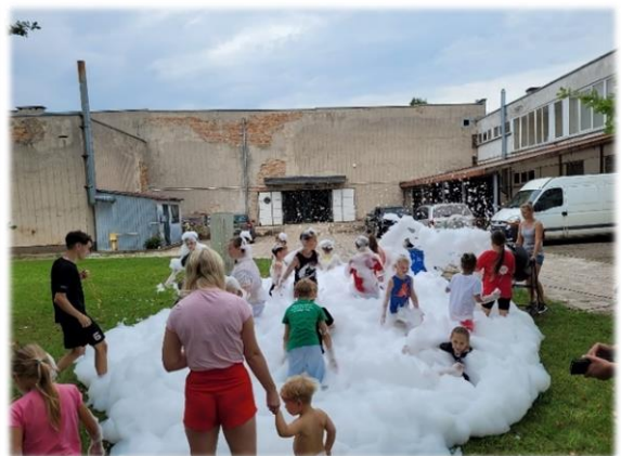
21 pav. Žolinių spartakiada