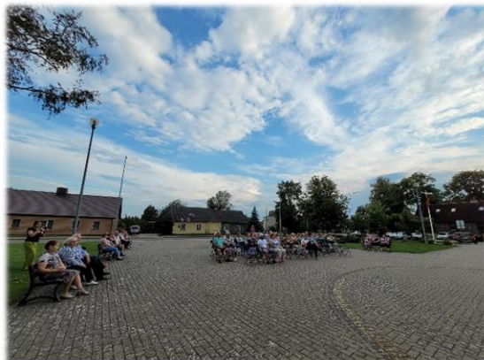
22 pav. Žolinės šventė

- Jakutiškių kaimo 280-ojo gimtadienio šventė (Žr. 23 pav.);