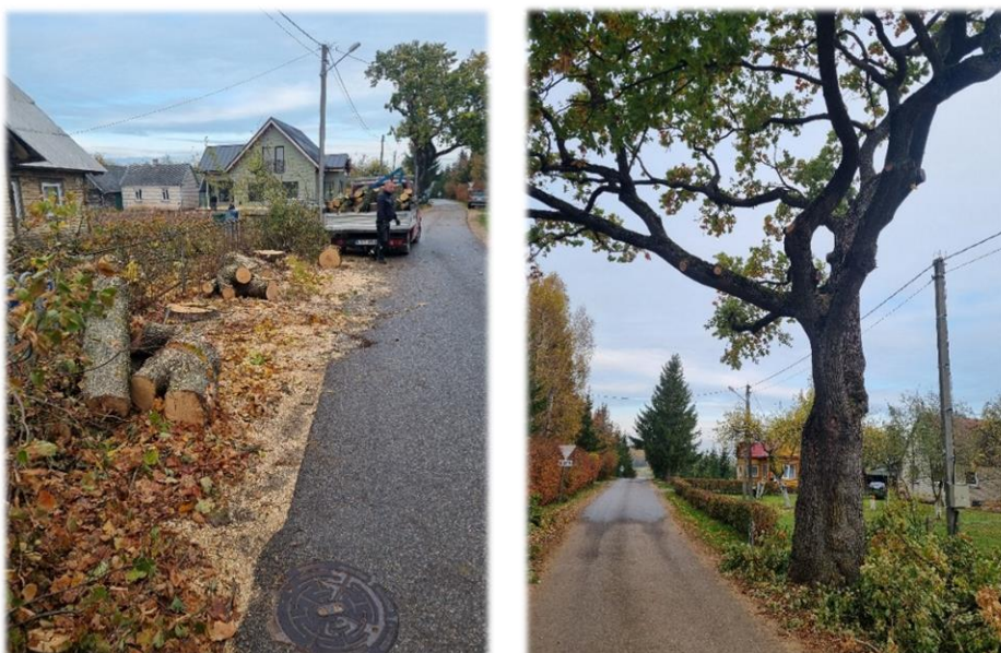
11 pav. Avarinių medžių šalinimas ir genėjimas Jonušų kaime