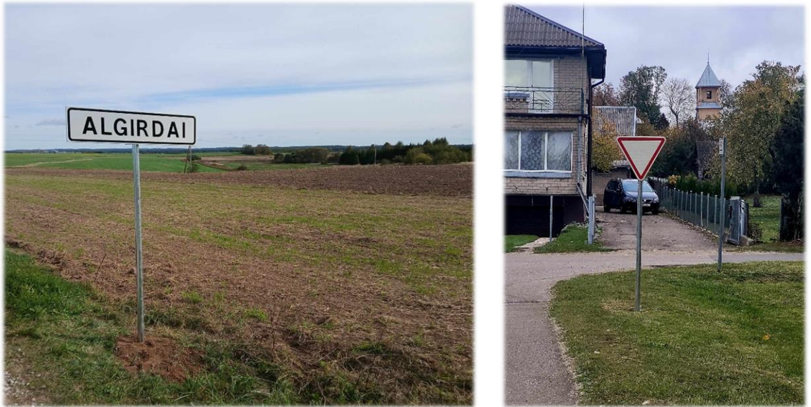
12 pav. Kelio ženklai Algirdų k. ir Deltuvos mstl.

kaime, kelio ženklas Nr. 120 „Nelygus kelias“ (2 vnt.) pastatytas Jakutiškių kaime, Jakutiškių gatvėje, kelio ženklas Nr. 616 „Gatvės pavadinimas“ (2 vnt.) pastatytas Statikų kaime, Statikų gatvėje. (Žr. 12 pav.);