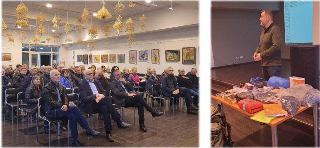
4 pav. Gyventojų sueiga su Savivaldybės parengties pareigūnu (ekstremalios situacijos parengties mokymai „Kuprinė“)

Seniūnijoje vykdyta gyvenamosios vietos deklaravimo funkcija: