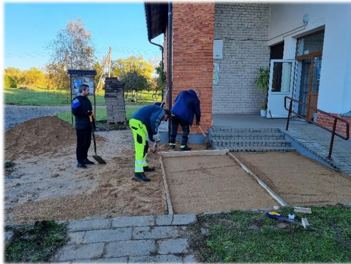
13 pav. Aikštelės įrengimas

- įrengta aikštelė Atkočių kaime (Žr. 13 pav.);