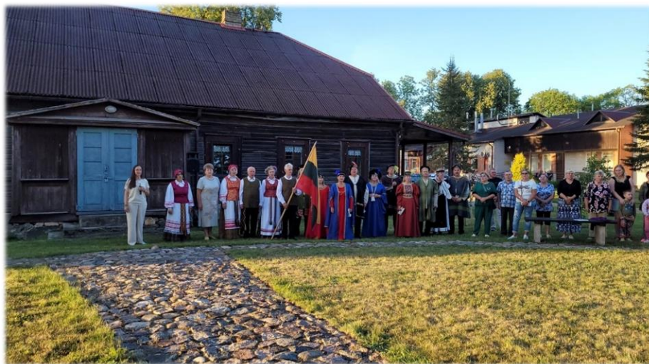
19 pav. Tautiškos giesmės giedojimas Deltuvoje

- Liepos 6-ąją – Valstybės (Lietuvos Karaliaus Mindaugo karūnavimo) dieną Tautiškos giesmės giedojimas Deltuvoje (Žr. 19 pav.);