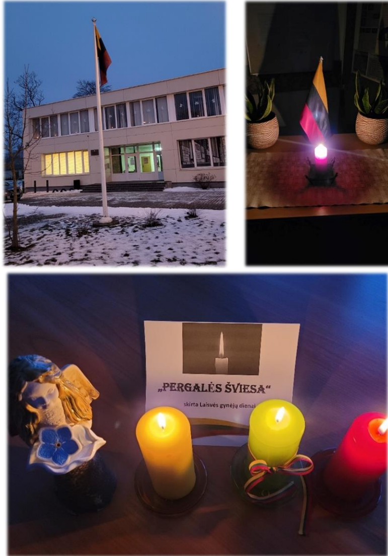
16 pav. Pilietinė akcija „Atmintis gyva, nes liudija“