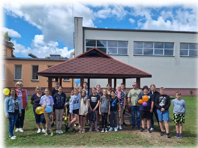
14 pav. Įrengta lauko klasė

- nuolat prižiūrėta ir tvarkyta įrengtų mišrių komunalinių atliekų ir antrinių žaliavų surinkimo aikštelių teritorija Deltuvos miestelyje, Atkočių, Jakutiškių, Statikų, Leonpolio, Dainavos kaimuose, prie Deltuvos kapinių, sodų bendrijų „Armona“, „Lelija“ ir „Statikai“. Informuotas atliekų tvarkymo paslaugos teikėjas dėl perpildytų atliekomis konteinerių išvežimo arba netinkamo aptarnavimo;