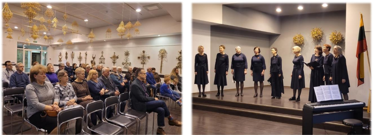
17 pav. Vasario 16-oji Deltuvoje