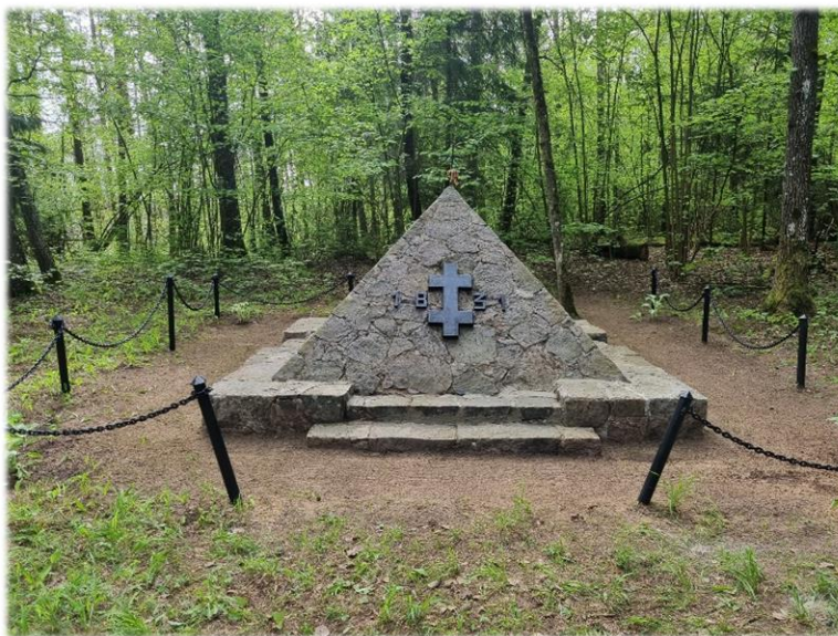
10 pav. Restauruotas paminklas 1831 m. žuvusiems sukilimo dalyviams atminti Skerdimų kalne.