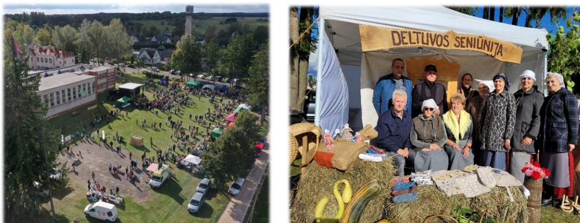
24 pav. Derliaus šventė

- Tradicinė Derliaus šventė „Aniuolų sargų kermošius 2024“ Lyduokiuose (Žr. 24 pav.);