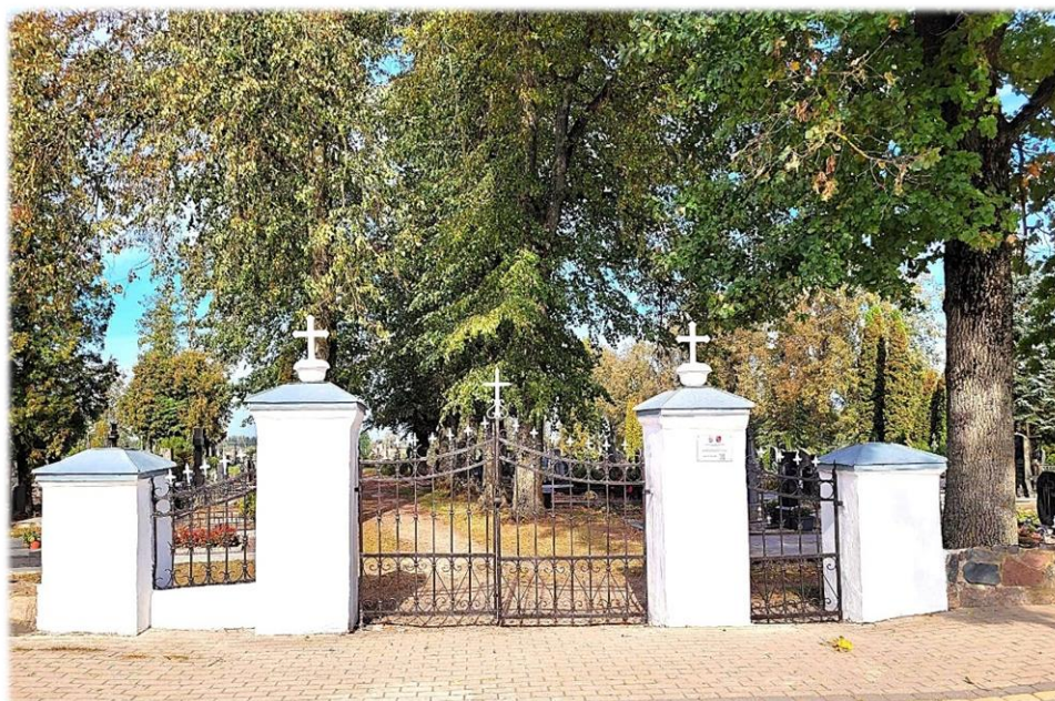
8 pav. Suremontuoti ir perdažyti kapinių tvoros vartai su kolonomis