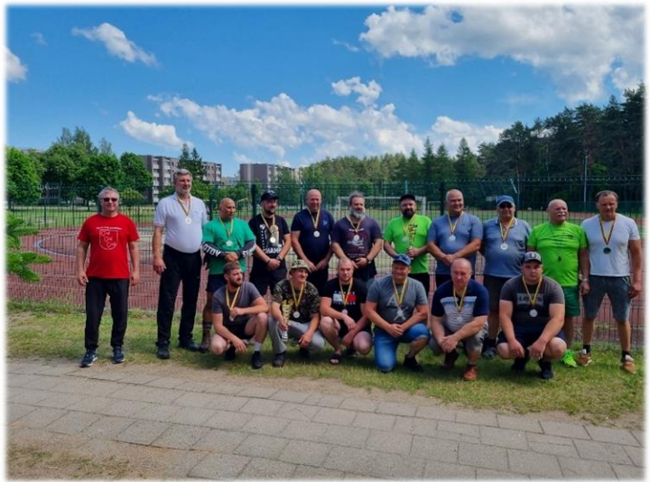
20 pav. Rajono seniūnijų sporto varžybos

- Tradicinė Deltuvos miestelio šventė „Žolinė“ (Žr. 21 pav. ir 22 pav.);