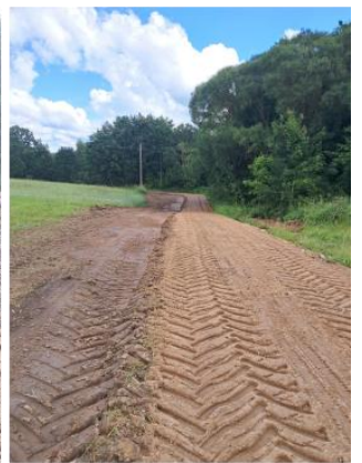
Suremontuotas kelias link Kazimieravos užtvankos