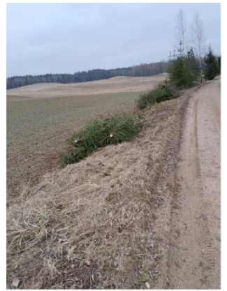
Pakelių krūmų šalinimas