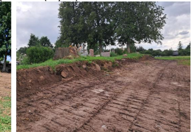
Sutvarkyta teritorija prie Šešuolių ir Dvarinių kapinių