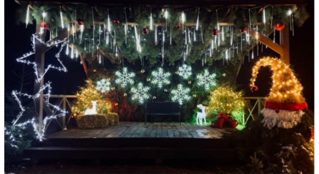
Šešuolių miestelio ir Liaušių kaimo Kalėdinės dekoracijos