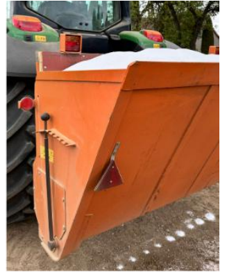
Kelių greideriavimo darbai ir kelių barstymas dulkėtumą mažinančiomis medžiagomis