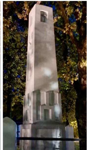
Įrengtas Laisvės paminklo apšvietimas