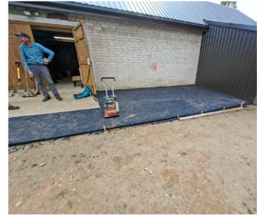
Išasfaltuota aikštelė prie seniūnijos garažo