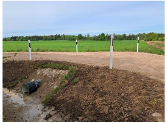
Pakeista pralaida Minikių kaime