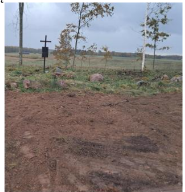
Sutvarkyta teritorija prie Gursčių kapinių