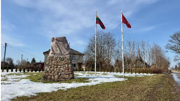
Prie Karžygio paminklo įrengtas naujas vėliavos stiebas