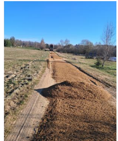
Asfaltbetonio duobių taisymas, žvyravimas išdaužų vietose