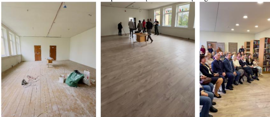
Suremontuotos bibliotekos patalpos Liepų g. 2, Liaušių k.