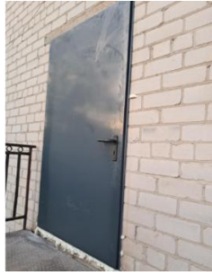
Pakeistos Liaušių kultūros namų durys