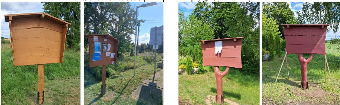
Įrengtos naujos skelbimų lentos