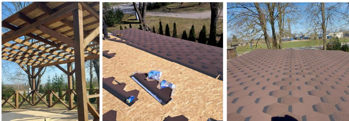
Pakeistas scenos prie Liaušių kultūros namų stogas