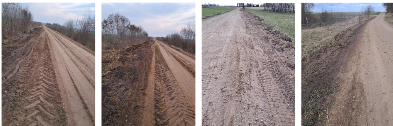
Kelio profilio atstatymas Kertušo, Bareišių, Dvareliškių, Paškonių, Minikių, Masiulių keliuose