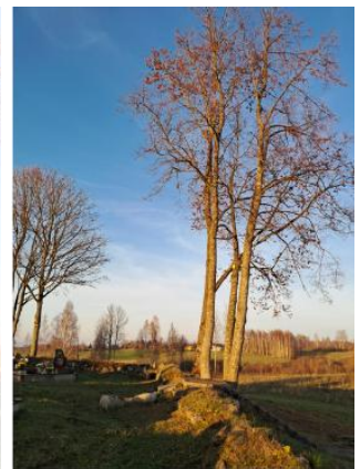
Pakeltos medžių lajos prie Mišniūnų kapinių