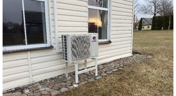
Šešuolių g. 30 įrengtas šilumos siurblys oras-oras

Įgyvendinant kaimo plėtros programą taip pat organizuojama kultūros namų ir bibliotekų ūkinė veikla, remontuojama ir atnaujinama aplinkos tvarkymo technika, prižiūrimi nenaudojami pastatai ir jų aplinka, prižiūrimos kapinės, vejos, vaikų žaidimų aikštelės, auginami gėlių daigai, prižiūrimi gėlynai ir želdiniai, organizuotas visuomenei naudingos veiklos atlikimas, vandens vežimas į Mišniūnų kapines, organizuotas šiferio, padangų ir stambiagabaričių atliekų išvežimas.